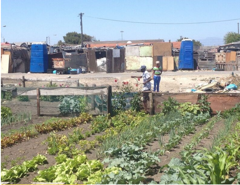
Urbane Landwirtschaft in den Townships in Kapstadt